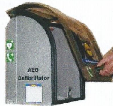
1. Deckel öffnen