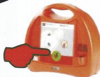
6. Falls das Gerät einen Schock anweist, drücken Sie die blinkende Schocktaste!