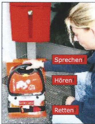
2. Trageeinheit entnehmen