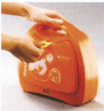
3. Defibrillator öffnen