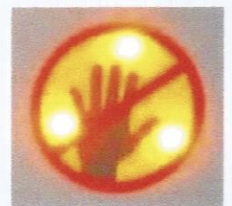
7. Patienten nicht berühren, Datenauswertung läuft!